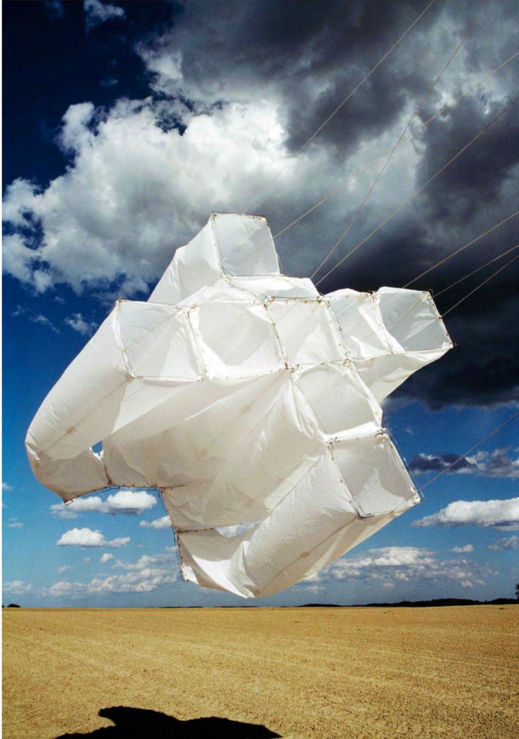
Forme multiple N°3, 1997 Lieu : Queensland/Australie

La forme Plastique BD, scotch, nylon L 500 x D 90 cm x 7 éléments