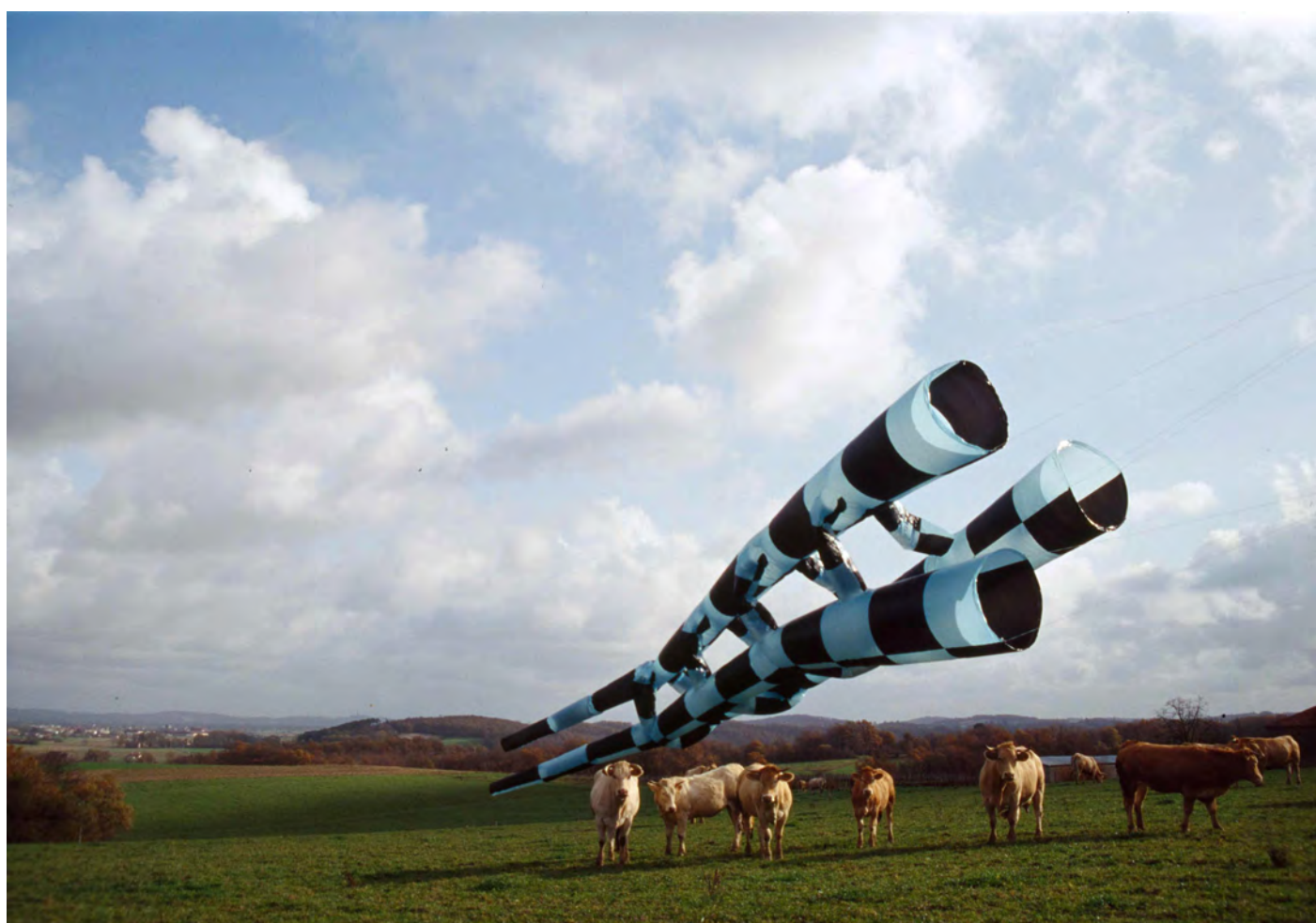
Forme multiple N°2, 1995 Lieu : St Mont (32)

La forme Plastique haute densité, scotch, nylon L 900 x D 90 cm x 3 éléments