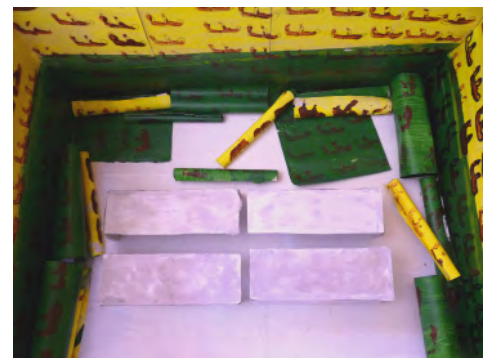
Espace pour disparaître Proposition 02 fermé (maquette, vue de dessus)