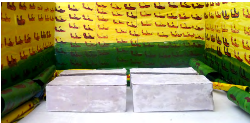
Espace pour disparaître Proposition 02 fermé (maquette)