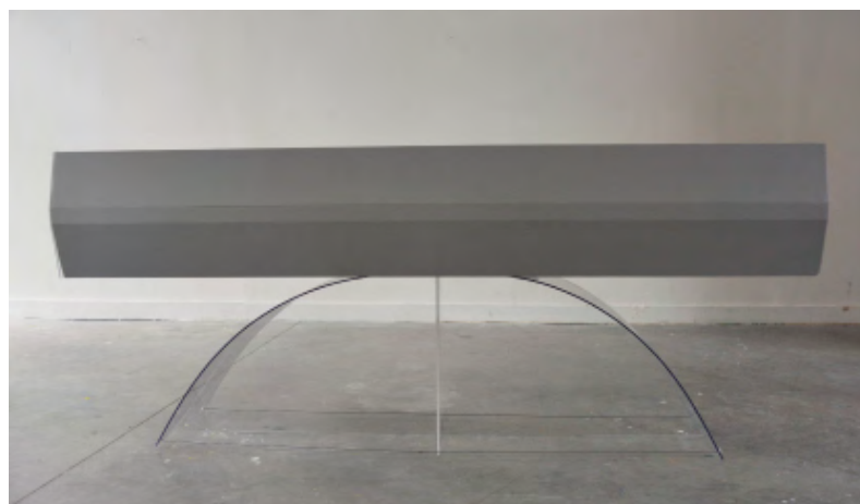
Tunnel sur Arcade