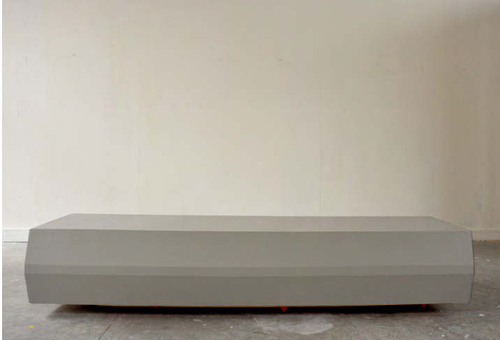
Tunnel Bois, plexiglass acrylique, 250/46/68cm 2016