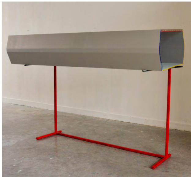
Tunnel sur Totem