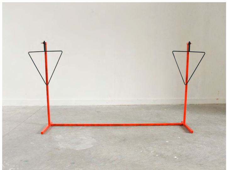
Totem acrylique, métal 250/120cm 2016