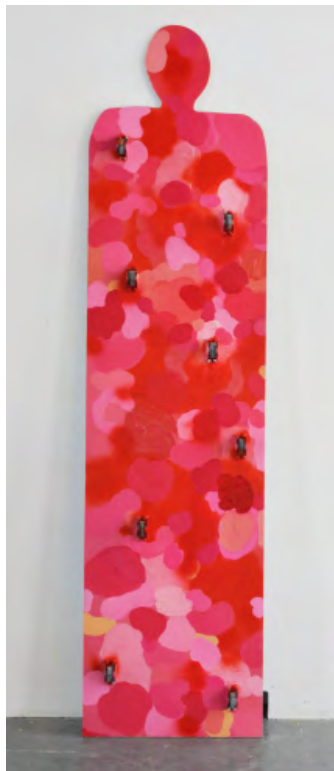
Mamelle, version peinture