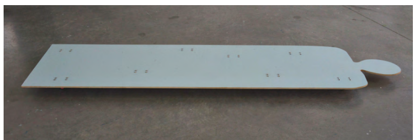
Mannequin, version planche à roulette