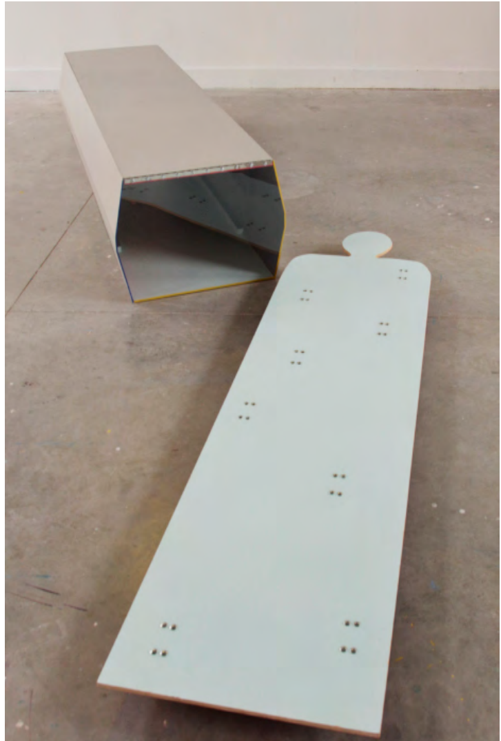
Détails Tunnel , Mannequin-Mamelle