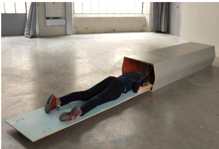
Activation de Mannequin-Mamelle dans Tunnel