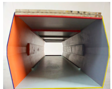
Vue à l'intérieur de Tunnel