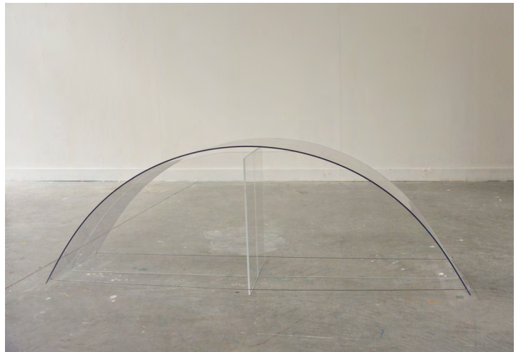
Arcade Plexiglass 250/120cm 2016