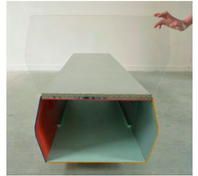
Détails, ouverture de Tunnel