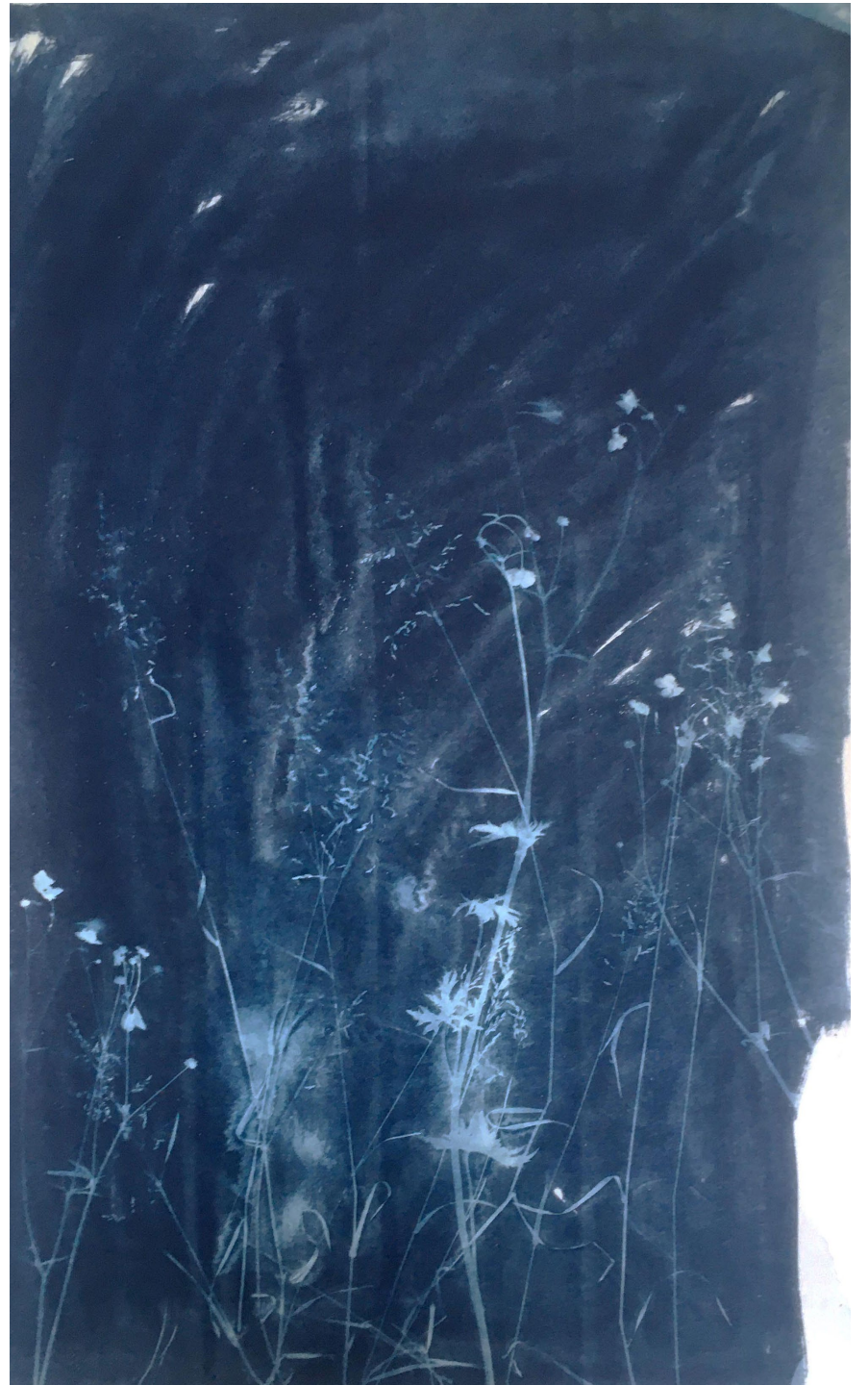
> Mauvaises herbes Cyanotype sur toile 78 x 126 cm 2020