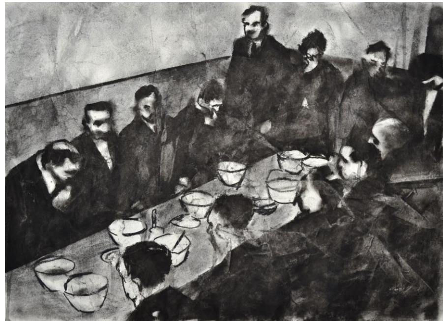
Splendeur et misère no.1/2/3/5, 2024 – 2025 fusain et encre de Chine sur papier noyé, 29,7 x 42 cm