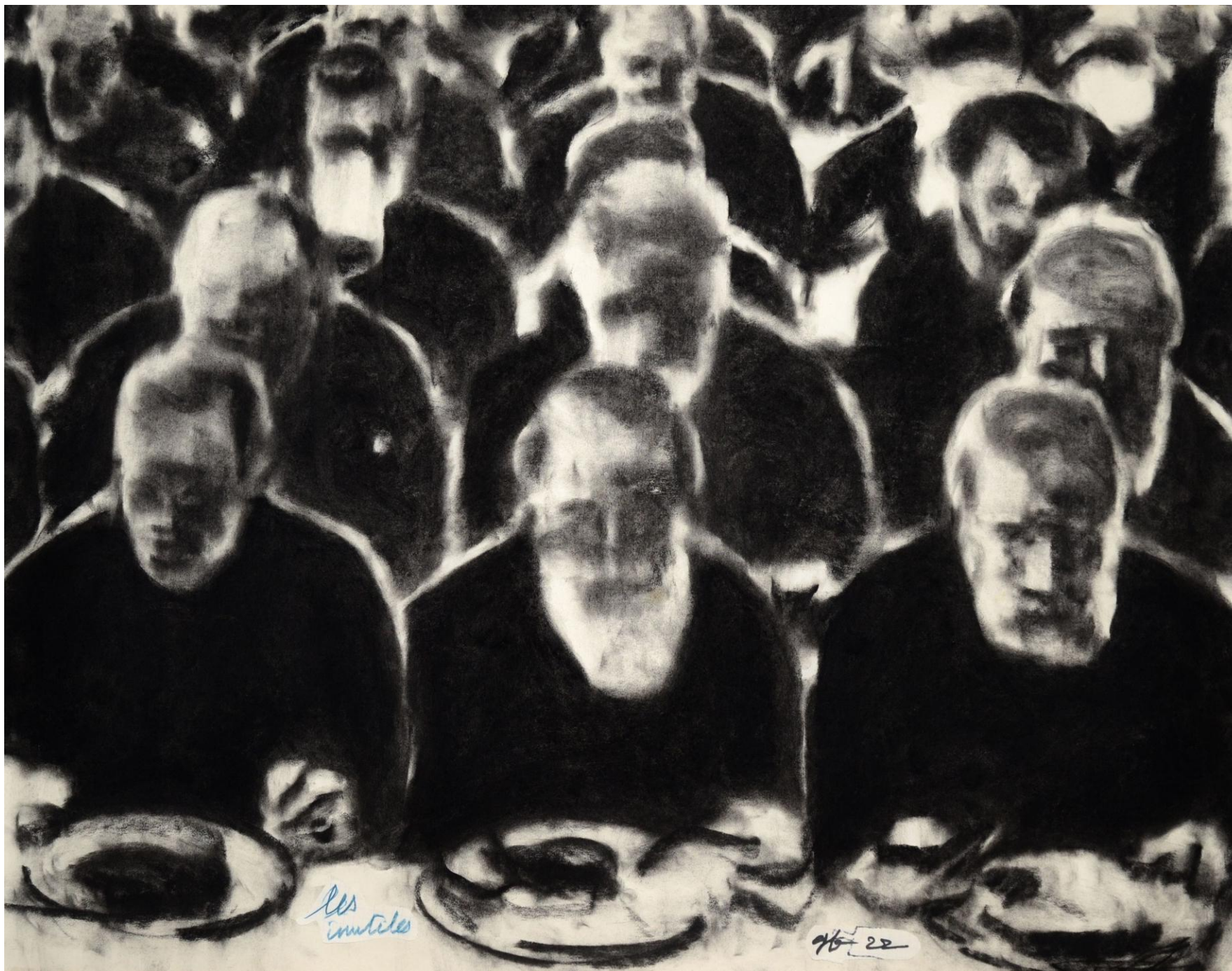
Les Inutiles, 2022, fusain sur papier peint, 53 x 67 cm, collection privée, Paris