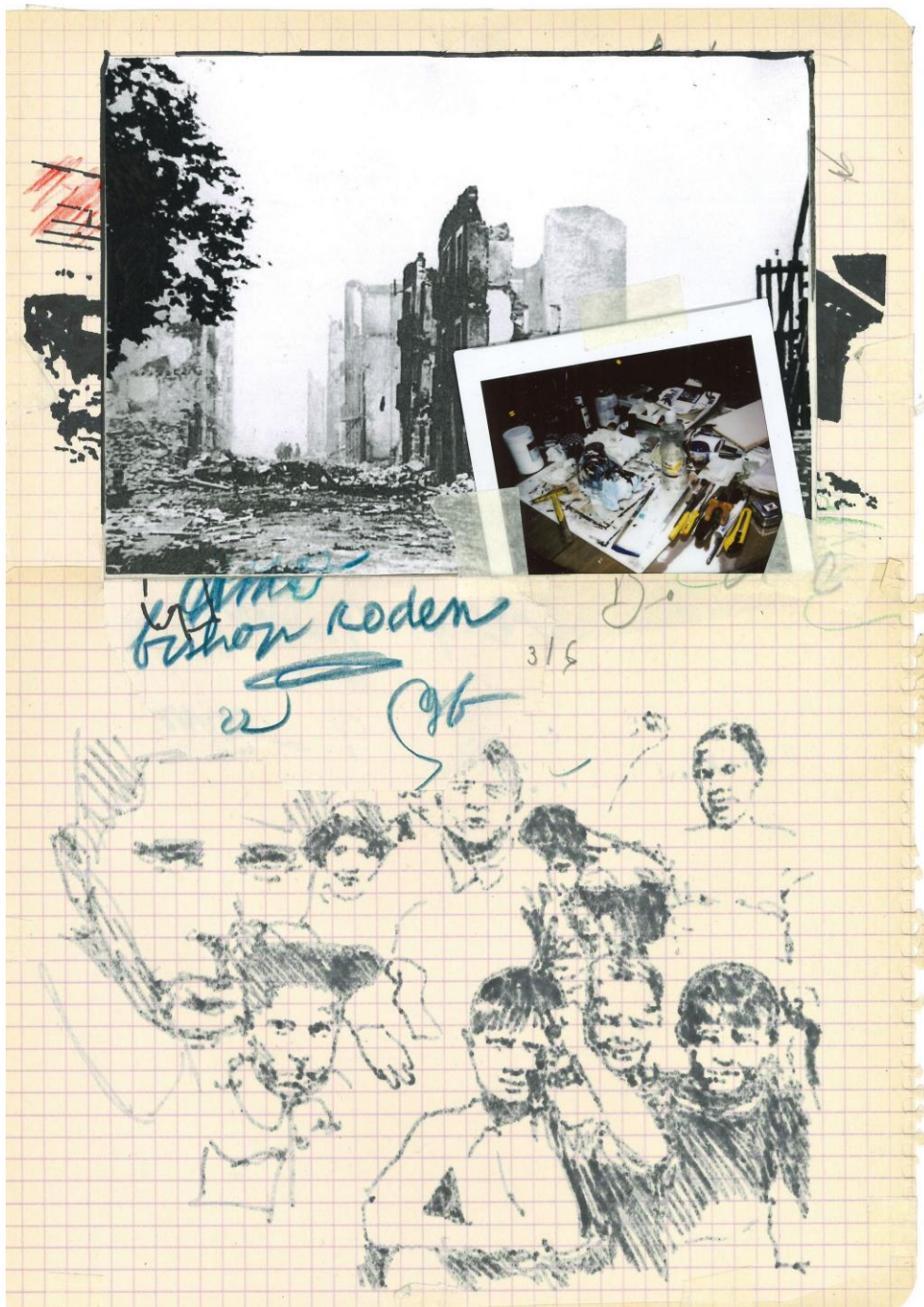
Amo Bishop Roden #3, 2022 , marqueur, crayon de couleur, photocopie, Polaroid et ruban adhésif sur papier, 29,7 x 21 cm, collection privée, Paris