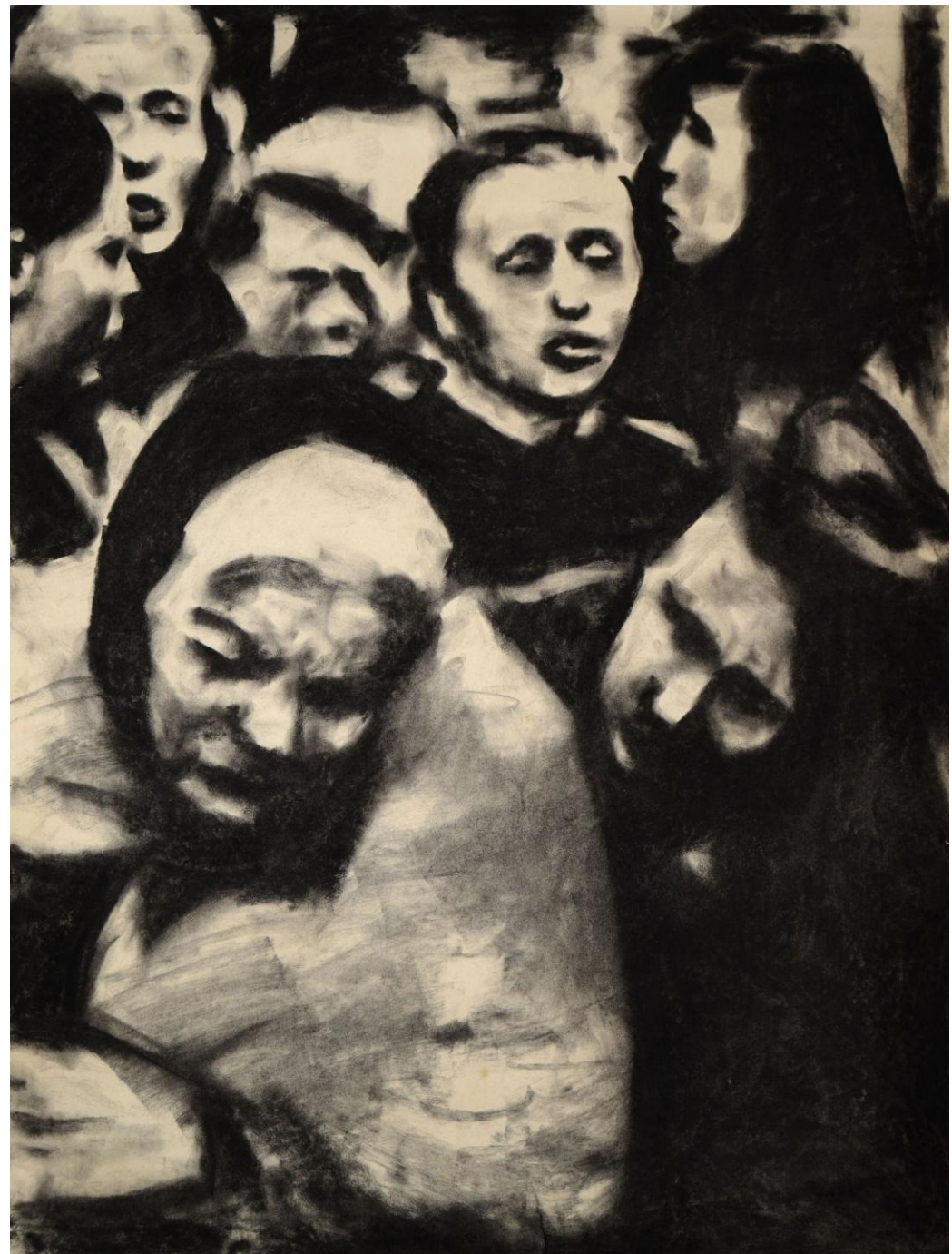
Sans titre (L'exode), 2022, fusain sur papier peint, 68 x 53 cm, collection Musée Jenisch Vevey, Suisse (CH)