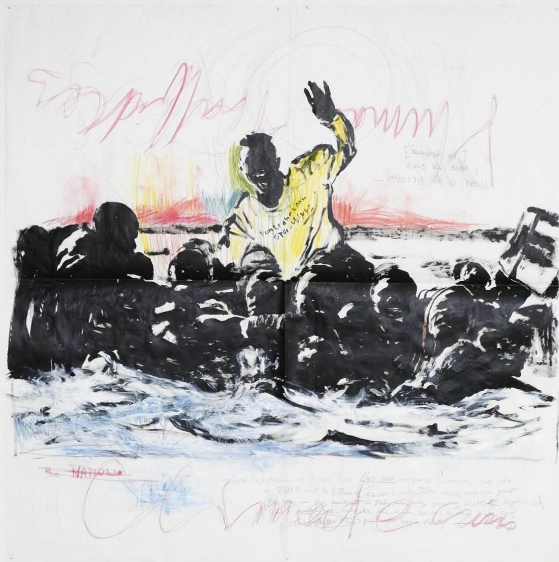
FRAC Grand Large, De leur temps (7) Un regard sur des collections privées , cur. Keren Detton et Michel Poitevin, Dunkerque, FR, 2023 The Nation , 2019, techniques mixtes sur papier, 150 x 150 cm, collection privée, Lille