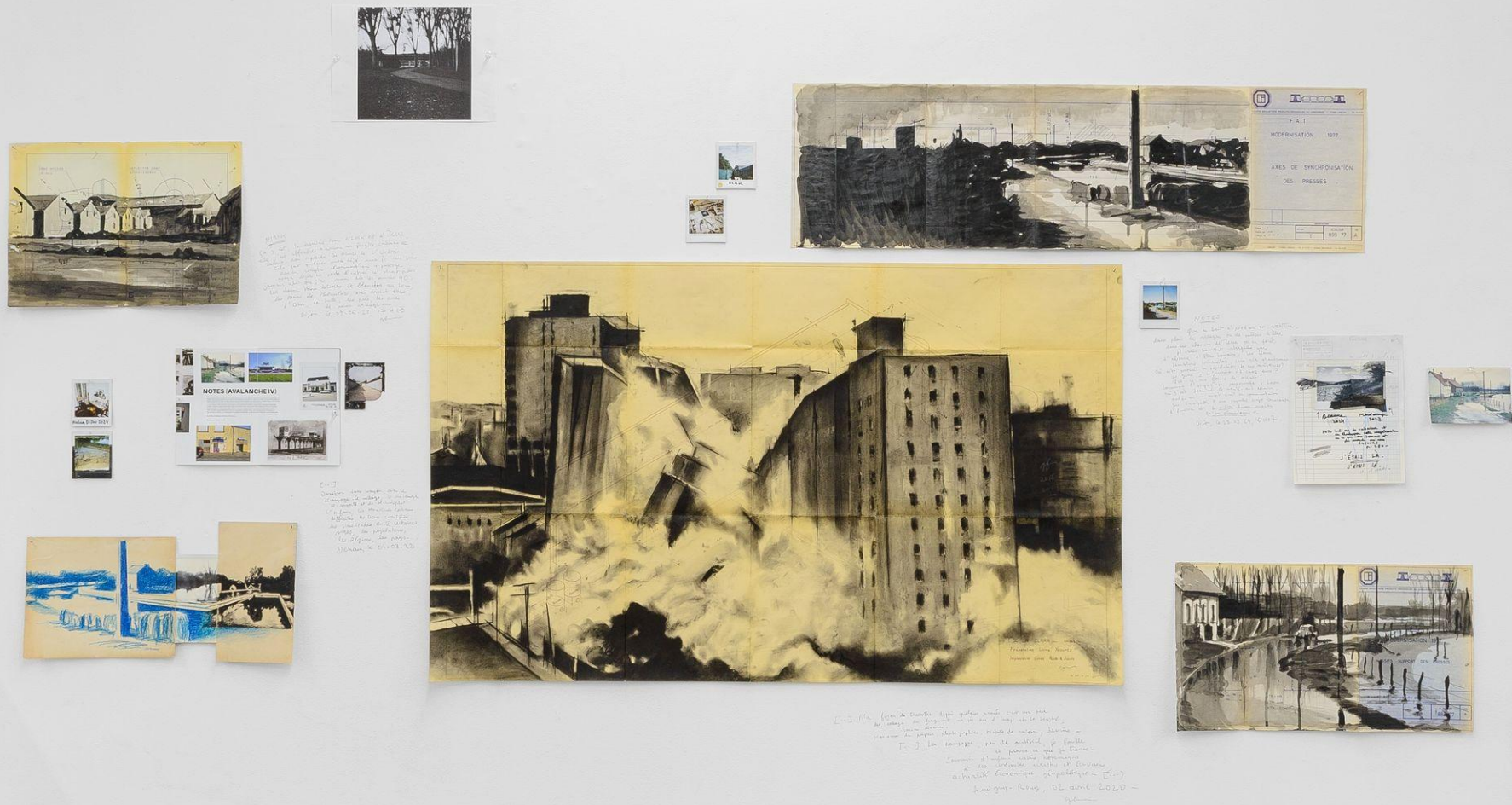
Galerie Sator (Marais), J'étais là , exposition personnelle, Paris, FR, 2024

J'étais là (mur de recherches), 2024, ensemble de pièces. Fusain, encre de Chine, crayon de couleur et marqueur sur divers papiers trouvés, Polaroids, photocopie, clous, multiple Avalanche 4 et textes personnels écrits au crayon mine sur le mur.