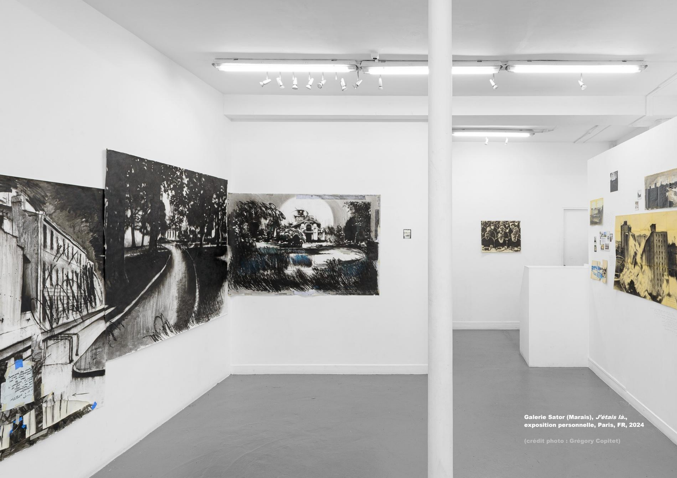
Galerie Sator (Marais), J'étais là. , exposition personnelle, Paris, FR, 2024