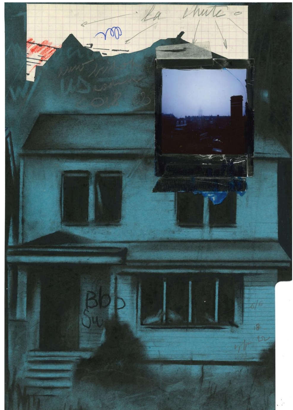
Amo Bishop Roden #6, 2022 , fusain, Polaroid, collage et ruban adhésif sur papier, 29,7 x 21 cm, collection privée, Paris