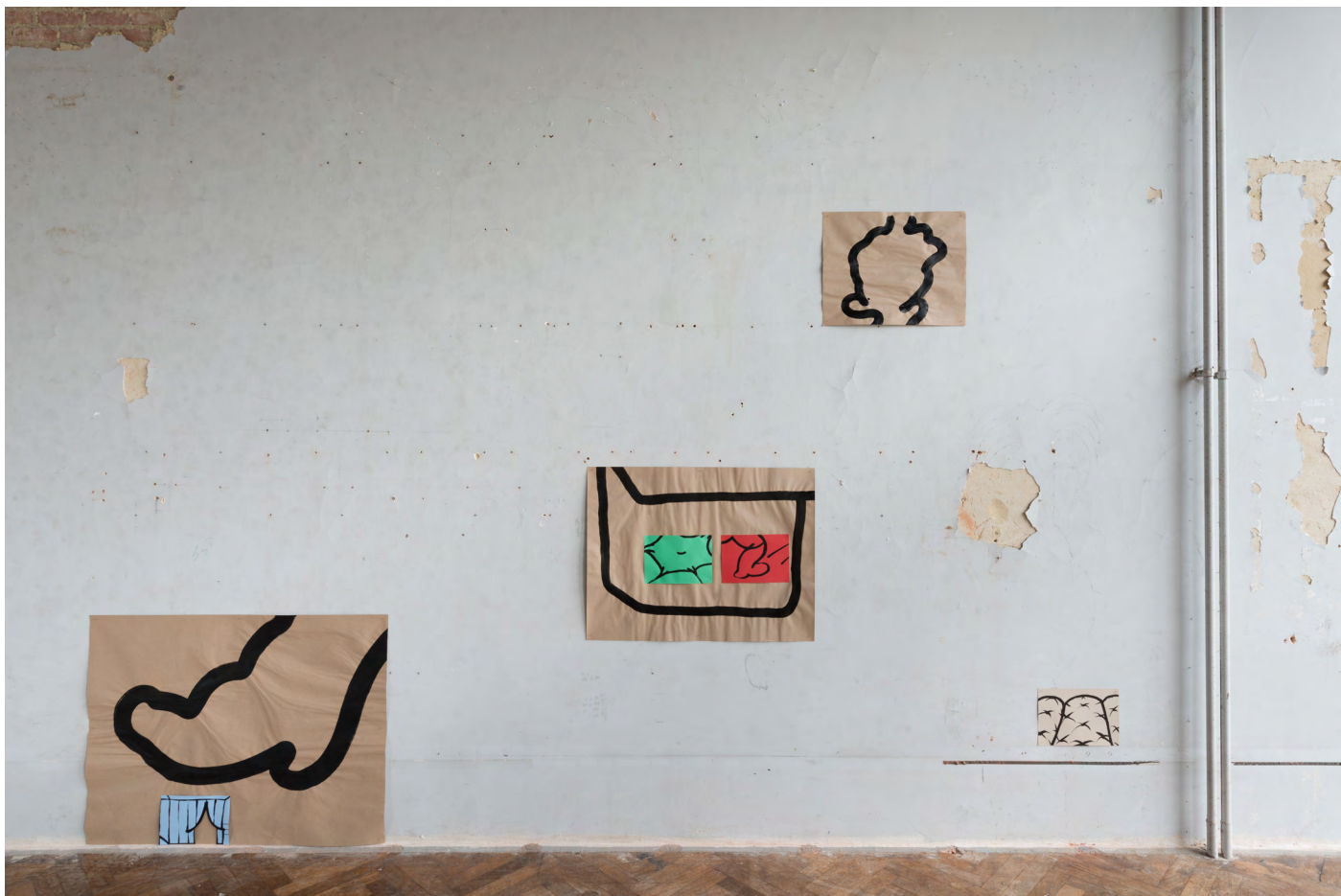
Suite #8, encres sur papier, octobre 2024 à Eleven Steens