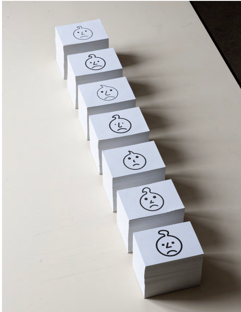
Discordial, bulletins de vote imprimés numériquement, 2025

On voit ce goût pour la mise en relation des images se révéler aussi dans des jeux plus légers, comme c'est le cas dans « Discordial ». Reprenant le caractère fonctionnel de Suite Croa, il s'agit cette fois d'un ensemble de bulletins de vote reproduisant les pictogrammes de 7 candidats bébés mécontents. Tous initialement destinés à communiquer une interdiction concernant les enfants de 0 à 3 ans, ils sont ici mis en regard pour faire valoir leurs différences morphologiques, mises côte à côte pour proposer une sorte d'élection nulle. Un peu comme une blague, une contemplation sur l'impossibilité à se décider et à se réjouir de l'état des choses, comme condition de la vie (du spectateur comme de l'artiste).