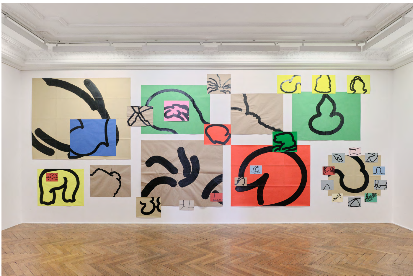
Suite #9, encres sur papier, décembre 2024 in «The Drawer - Une Nouvelle Génération du Dessin» à l'Hôtel des Arts de Toulon