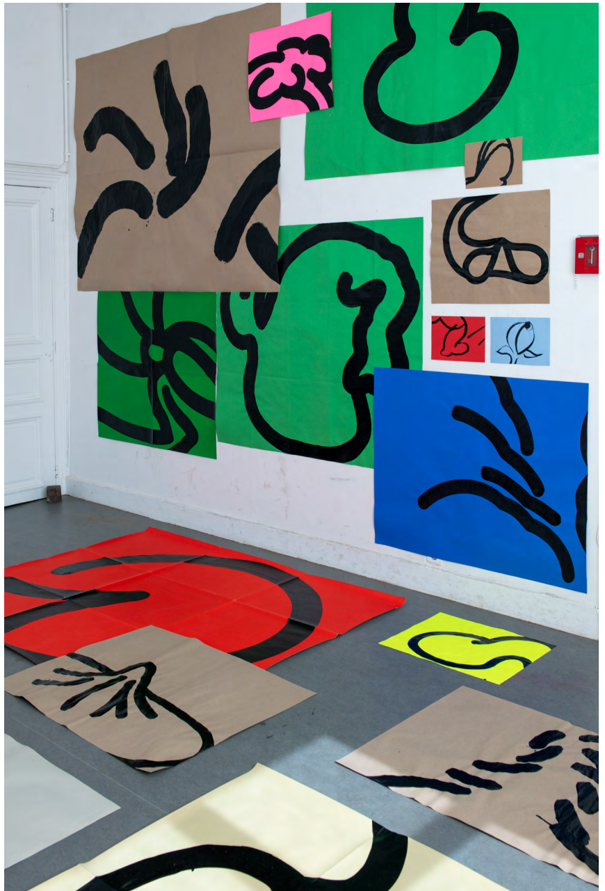
Suite #6, encre sur papier, juin 2024 at Maison des Arts de Schaerbeek

A chaque réactivation, la totalité des dessins réalisés est revue afin de constituer des combinaisons spéciales, des associations de sens parlantes qui racontent le monde, racontent nos manières de raconter surtout, mettent en exergue la composition autant que la narration.