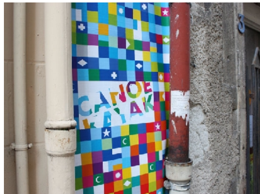
Haut en couleur—Pau, 2009