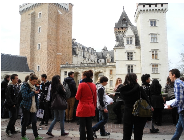
Balade urbaine en centre ville à Pau, décembre 2012

Depuis octobre 2012, l'association Destination Patrimoine et le Bel Ordinaire développent ensemble le parcours Lire la ville, écrire sa ville avec trois établissements scolaires palois. Ce programme, élaboré par la DAAC du rectorat de Bordeaux en partenariat avec la DRAC Aquitaine, croise les domaines artistiques, les disciplines scolaires et construit des regards multiples sur cette réalité complexe qu'est la ville.