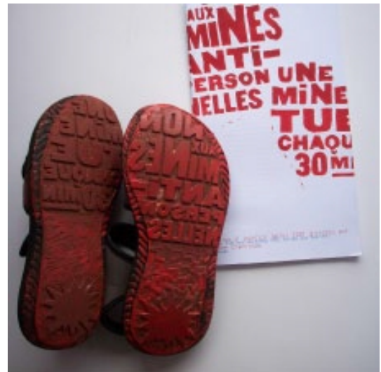
Avis au public