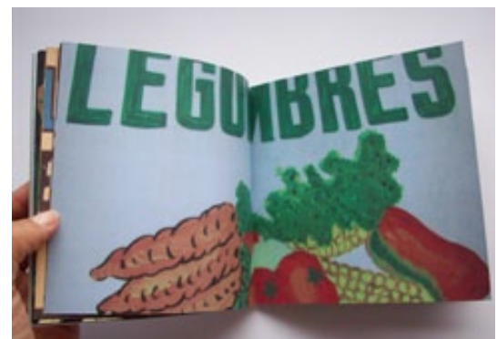
Hecho en Medellín