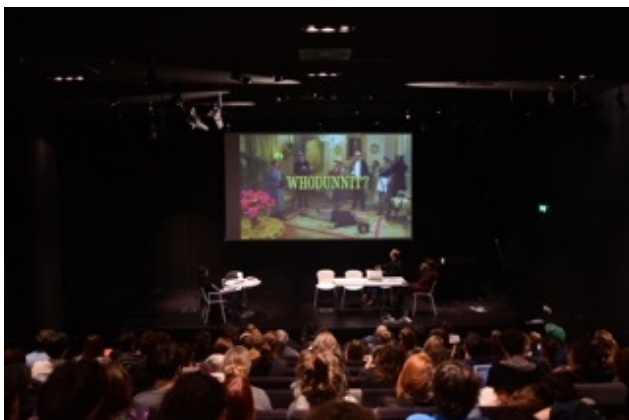
Table ronde : « Écritures numériques et espace public », nov 2012