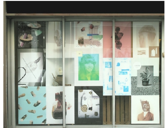
Exposition au centre d'art à Image/Imatge