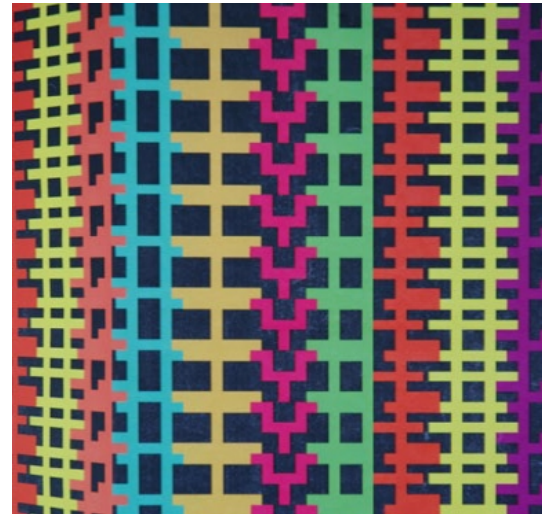
Papier peint / je suis d'ici et de là-bas

http://en214b.files.wordpress.com/2013/01/portfolio_luzmaryvargas_2012.pdf