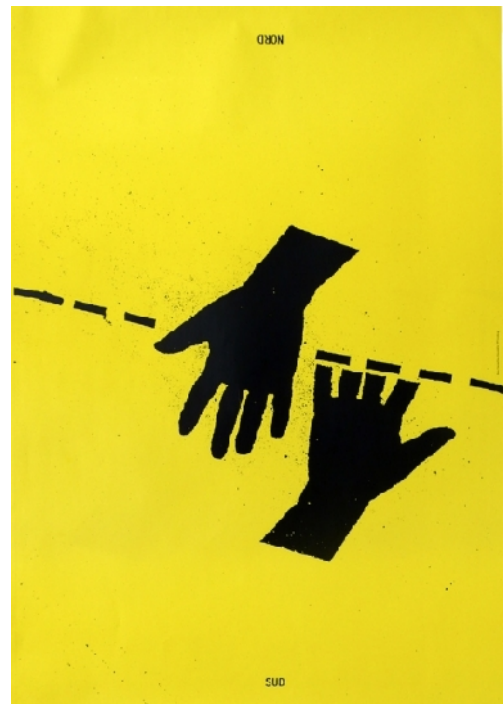
Nous Travaillons Ensemble Nord Sud (1992)