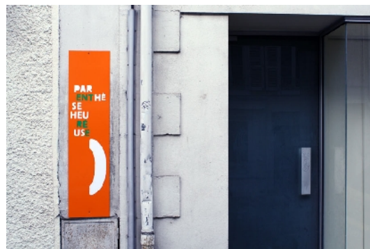
Ouvrez l'Œil—Pau, 2009