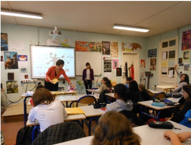
Présentation du métier de graphiste —février 2013