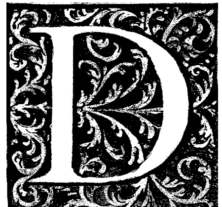
Letterine D

À la façon d'un copiste, réalise une belle enluminure pour les initiales du BO. Tu peux dessiner dans les lettres ou autour d'elles. Voici un exemple :