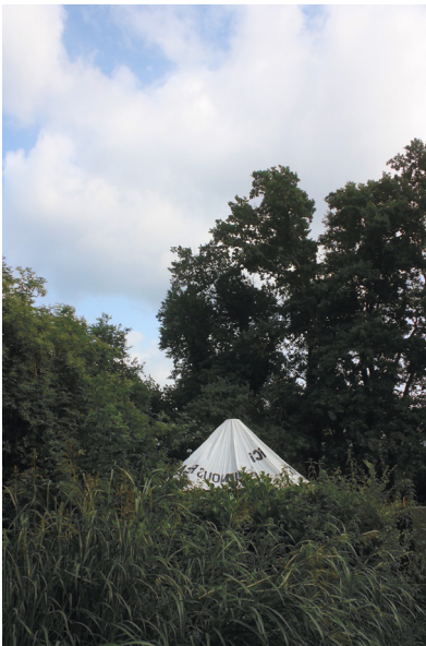
© Margoy Laforge, Ce qui nous regarde

Appuyé sur les travaux d'anthropologues, d'historien·nes ou de sociologues, le mémoire traite des actes graphiques en montagne et de leurs multiples formes et fonctions : enjeux de prévention, d'influence, d'indication et historiques.