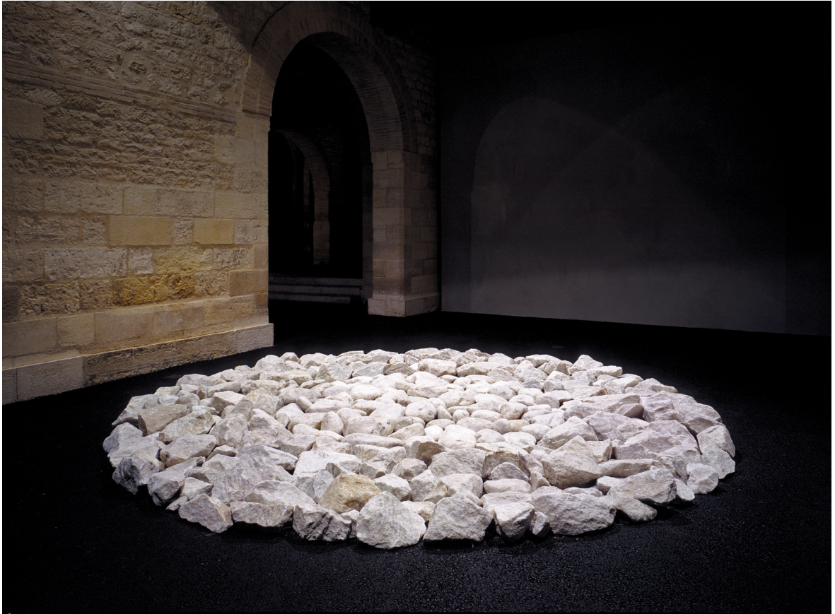
--- Richard Long (1945-), River and Mountain Circle , 1991, [cercle de rivière et de montagne], marbre blanc et galets, diam. 400 cm, coll. Frac Nouvelle-Aquitaine MÉCA, © Adagp, Paris, photo Frédéric Delpech. ---

Richard Long aime aussi rapporter de ses pérégrinations des matériaux (roches, bois flottés, argile – avec lesquels il élabore des sculptures, comme ce River and Mountain Circle [cercle de rivière et de montagne], 1991. Compte tenu de son poids et de sa mise en œuvre, la présentation à la Maison de la montagne de cette pièce majeure de la collection du Frac Nouvelle-Aquitaine MÉCA constitue un véritable événement. Installée au sol de la salle d'exposition de la Cité des Pyrénées, la sculpture se présente comme un cercle de quatre mètres de diamètre composé de marbre blanc provenant de la Vallée Maggia (canton suisse du Tessin). Les galets roulés par l'eau de la rivière formant le disque central sont entourés par les pierres brutes aux angles aigus.