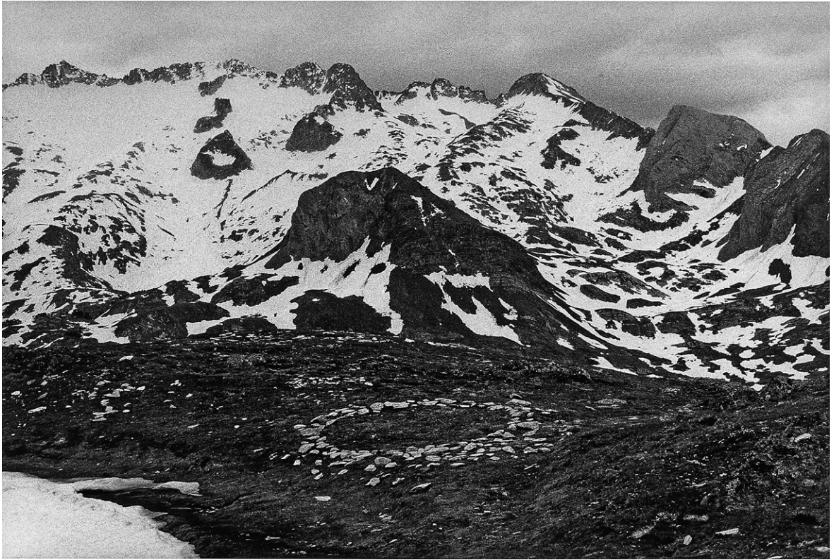
--- Richard Long (1945-), A Circle in Huesca , 1994, A 5 day walk of 169 miles from Huesca in Spain to Illartein in France crossing over the Pyrénées on the fourth day. Pirineo Aragonés. [Une marche de 169 miles de Huesca en Espagne à Illartein en France, en traversant les Pyrénées le quatrième jour. Pyrénées aragonaises, 1994.] Diputación de Huesca, CDAN, Fundación Beulas, coll. Arte y Naturaleza. © Adagp Paris 2020. ---

En 1994, Richard Long marche depuis Huesca, en Aragon, vers Illartein, en Ariège. Chemin faisant, il dessine un cercle de pierre, face au massif de la Maladeta. Le CDAN (Centro de Arte y Naturaleza) de Huesca conserve dans ses collections une photographie documentant cette action : c'est une image en noir et blanc, avec au premier plan, un arrangement de pierres claires en forme de cercle, posées sur un replat sombre. En arrière, des montagnes, crêtes et pics, pentes et rochers, glaciers et névés : quelques-uns des plus hauts sommets des Pyrénées. C'est sur un agrandissement de cette image que s'ouvre l'exposition à la Maison de la montagne.