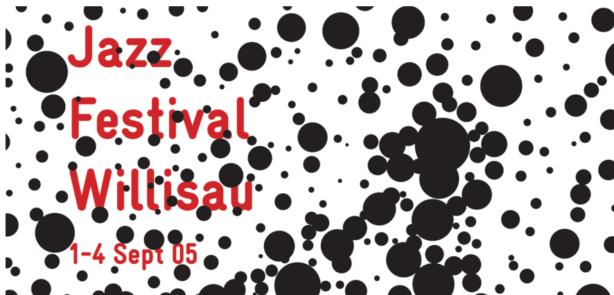
détails de deux affiches de Niklaus Troxler pour le Jazz festival Willisau